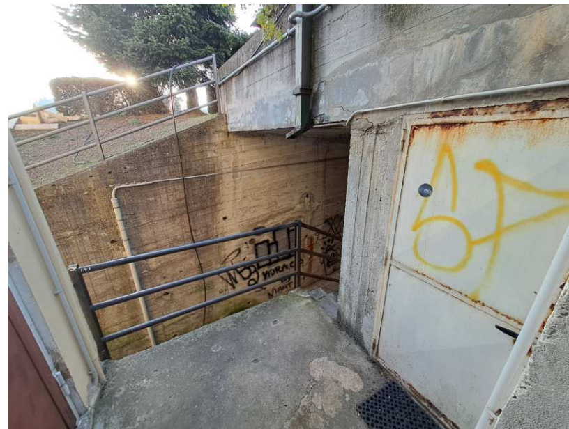
26 - articolare del pianerottolo lato nord-ovest