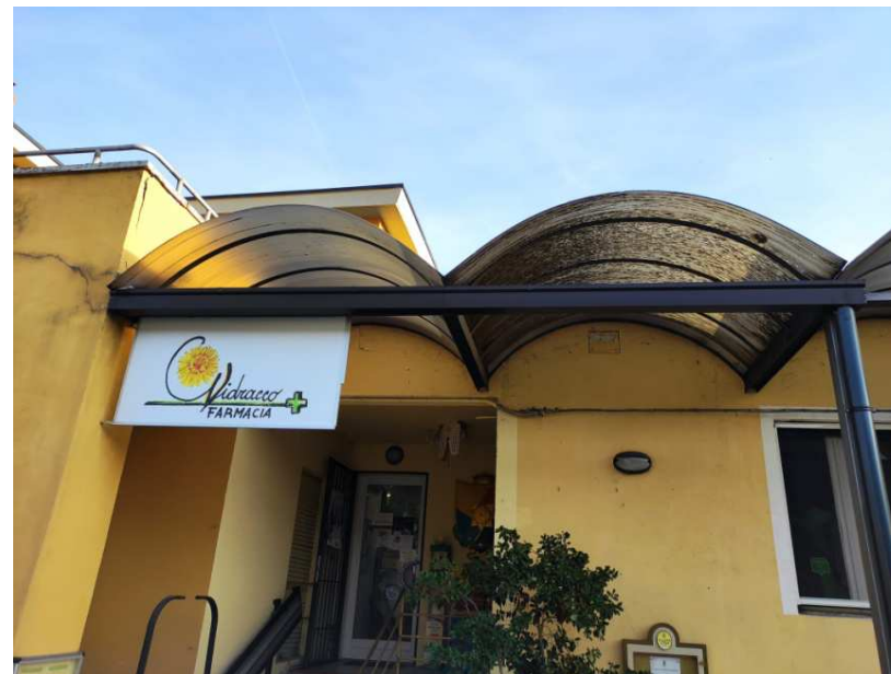
11- Particolare della pensilina all'ingresso della farmacia