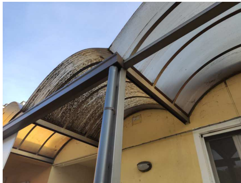
16 - Particolare della copertura della pensilina