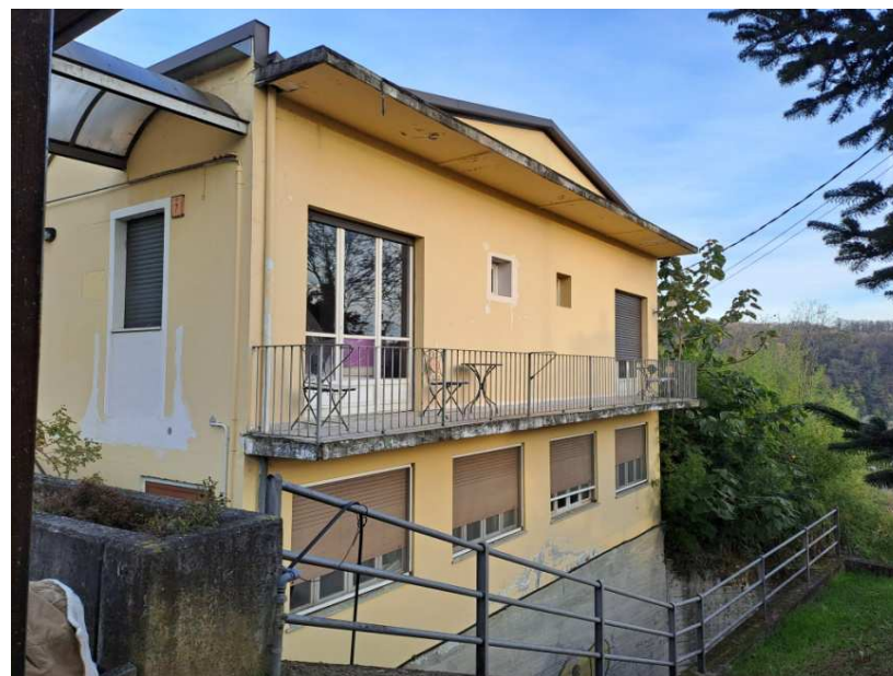
4- Prospetto ovest del fabbricato