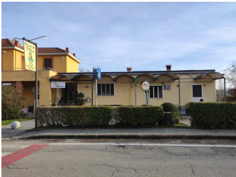
5- Prospetto nord della porzione interessata