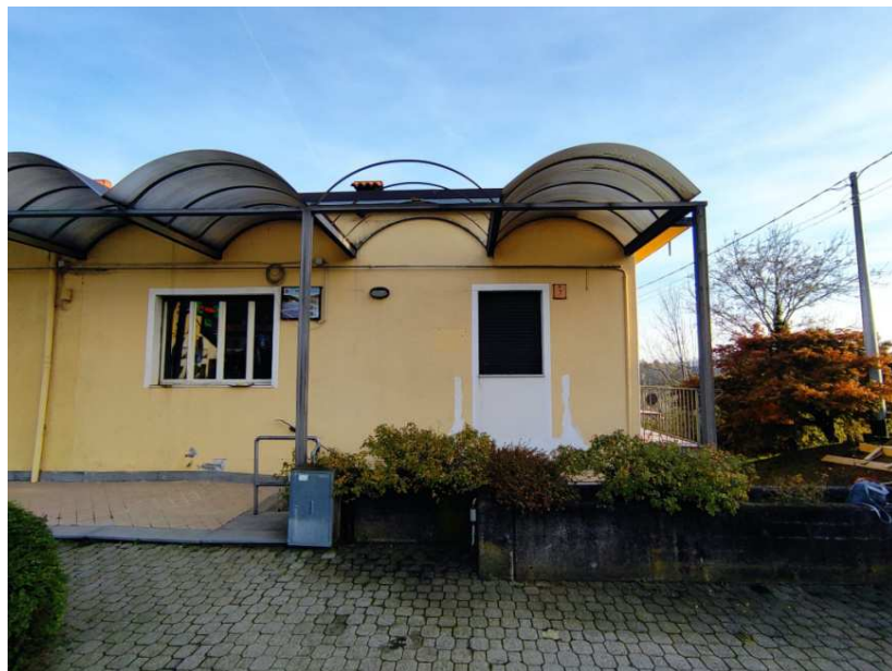
9- Prospetto nord - particolare