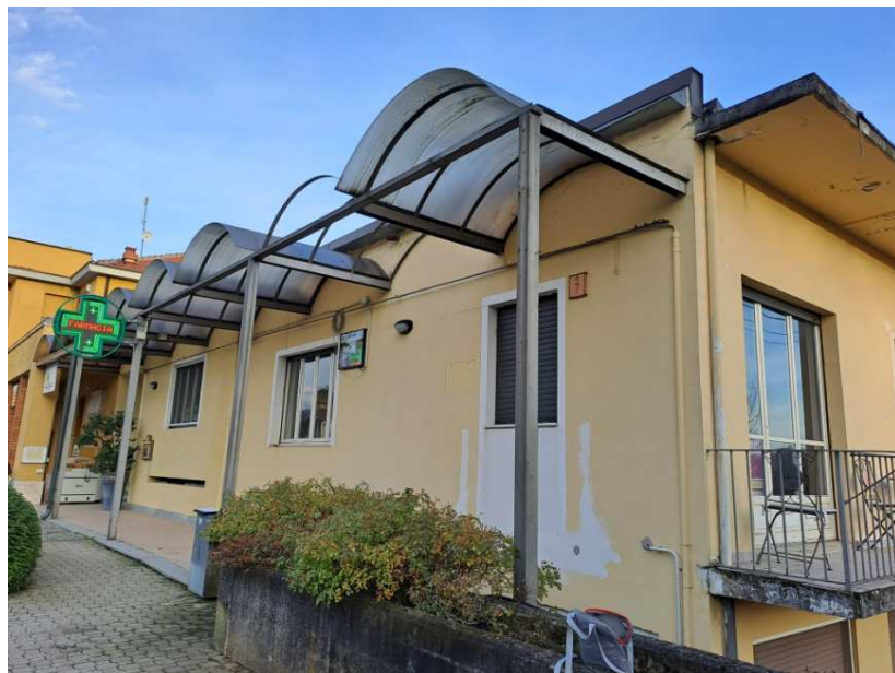
20 - Prospetto nord-ovest