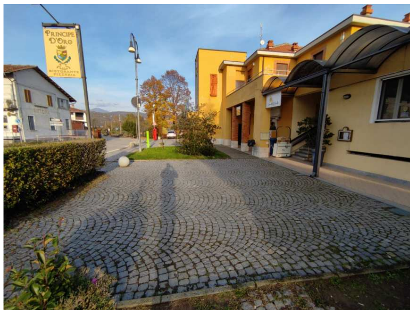
6- Piazzetta antistante il fabbricato