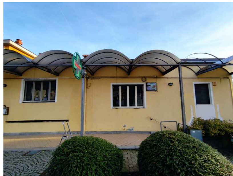
8- Prospetto nord - particolare