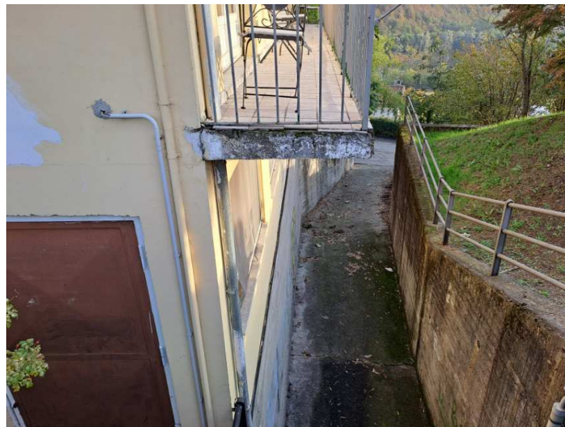
25 - Particolare del balcone e della strada lato ovest