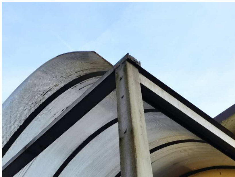
13- Particolare della pensilina