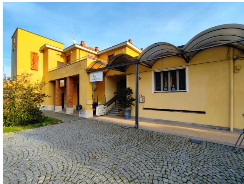
7- Piazzetta antistante il fabbricato