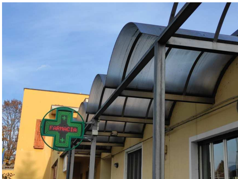
10 - Prospetto nord - particolare della pensilina