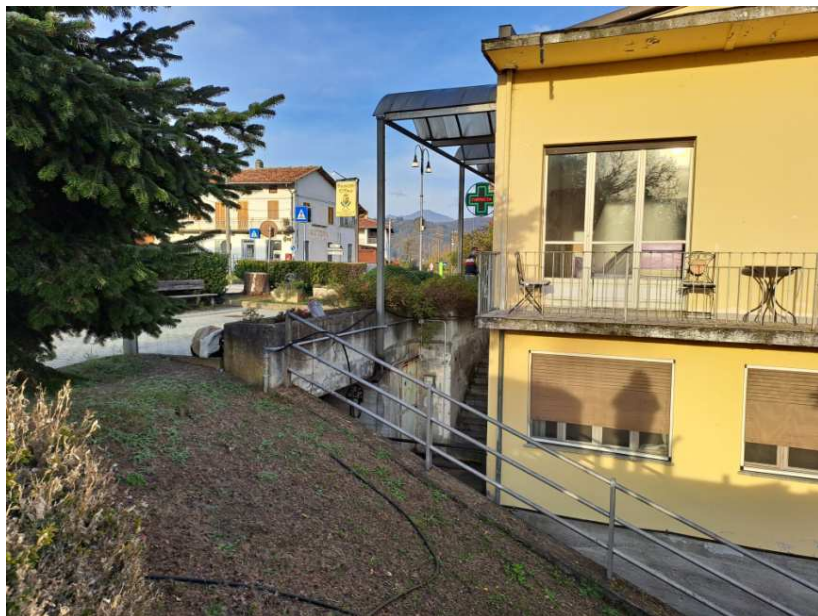
25- Lato ovest - particolare