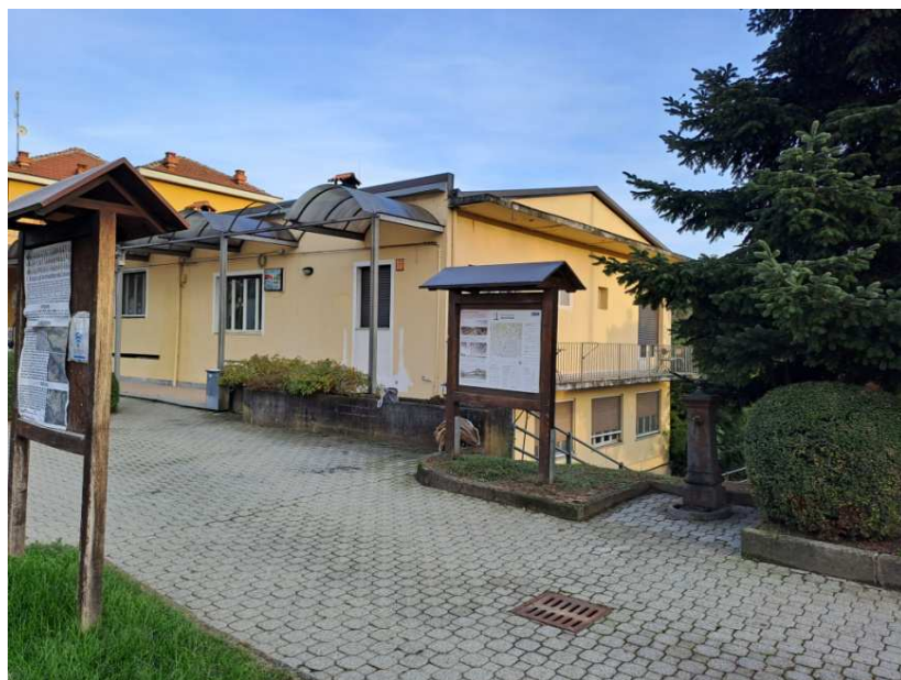
2- Prospetto dell'immobile interessato