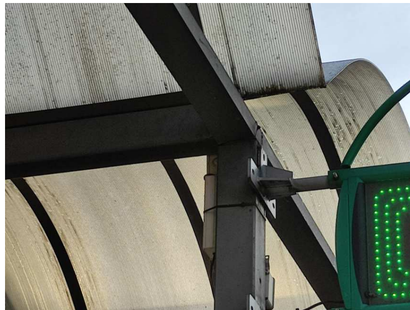
15- Particolare della pensilina