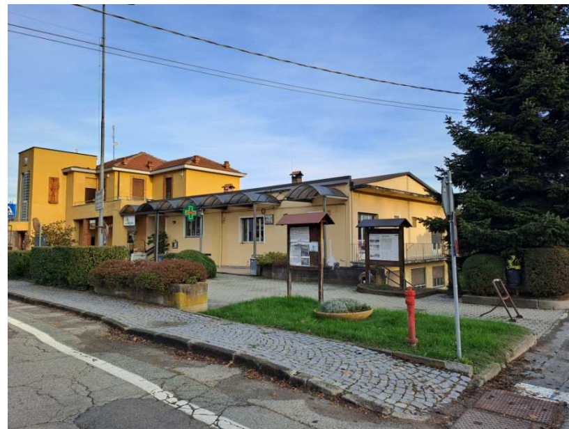
3- prospetto dell'area interessata e del Municipio