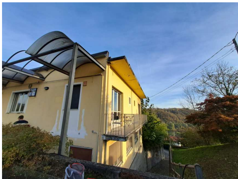
21- Prospetto nord-ovest