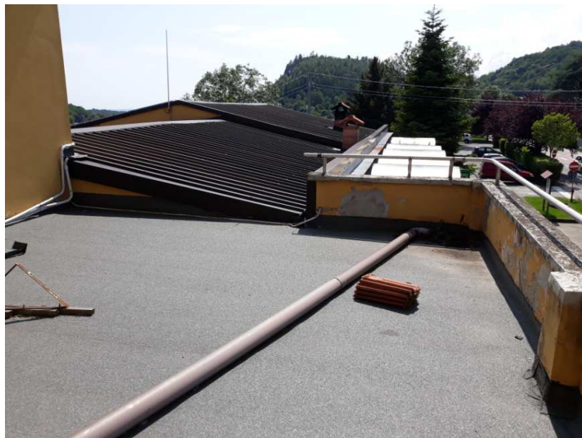
17 - Particolare della copertura del fabbricato