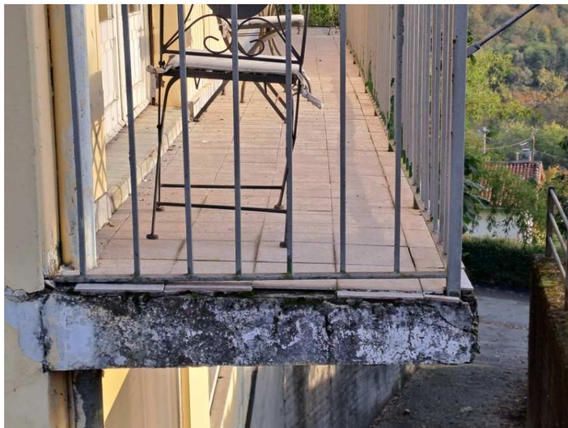
24- Particolare del balcone lato ovest