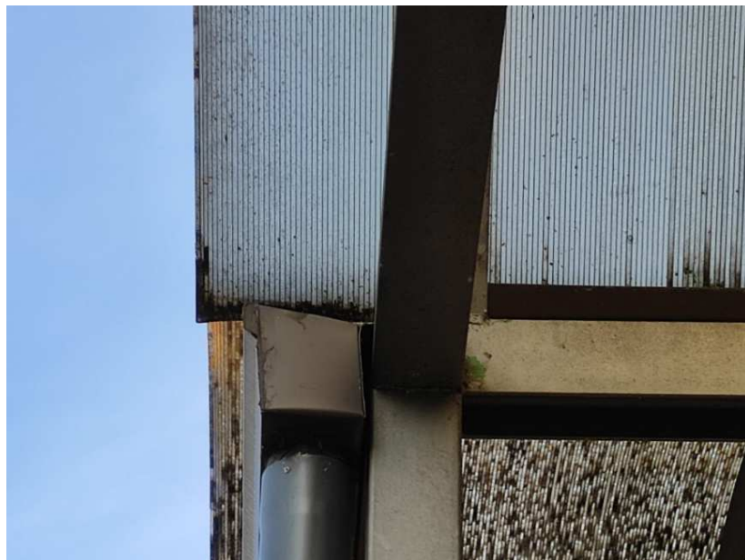
14- Particolare della grondaia