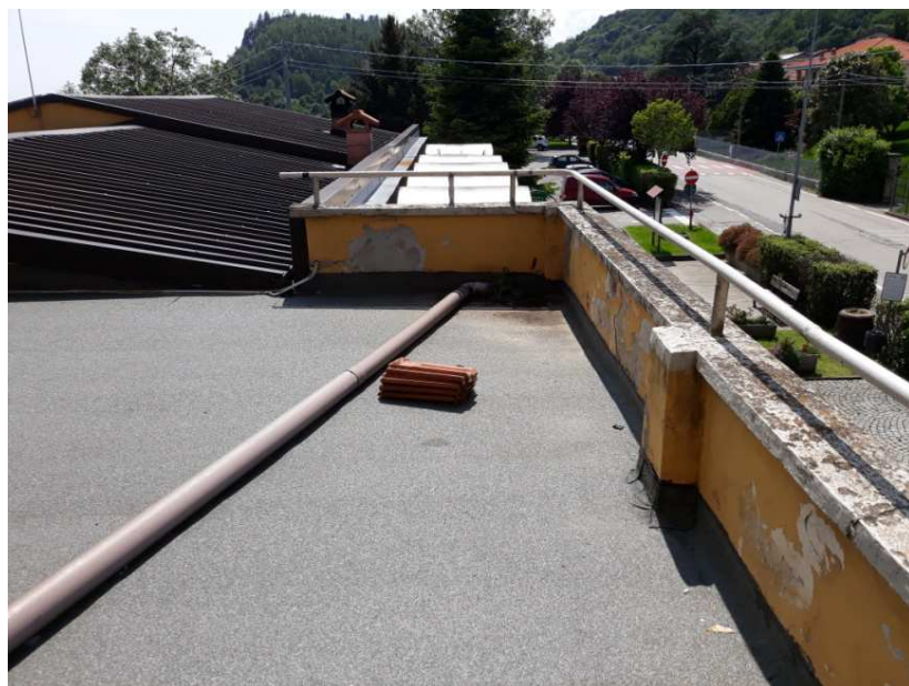
18- Particolare della copertura della pensilina