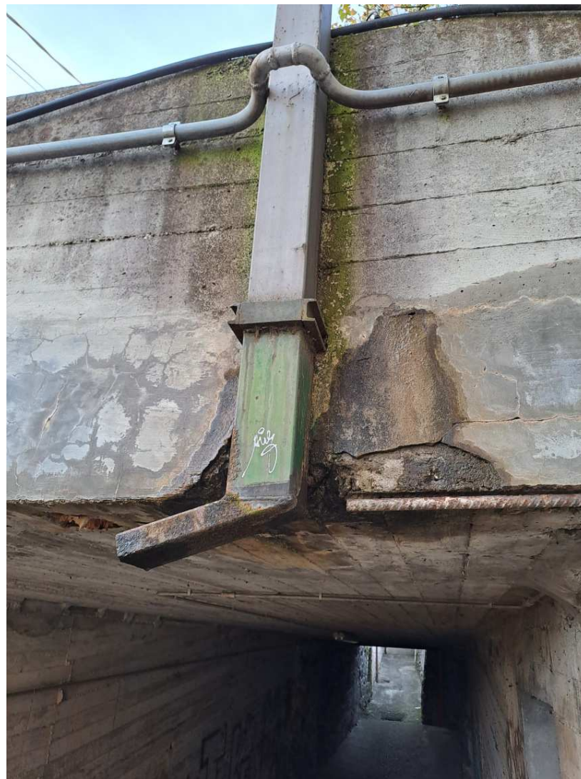
28 – Particolare dell'aggancio di uno degli elementi verticali della pensilina alla soletta in c.a.