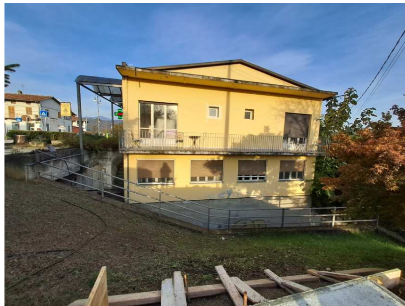
22- Prospetto ovest