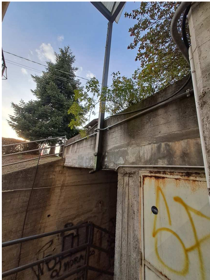
27 – Particolare dell'aggancio di uno degli elementi verticali della pensilina