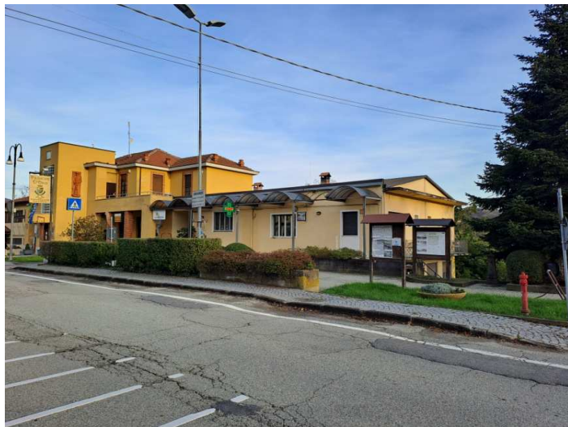
1- Prospetto nord verso la Provinciale