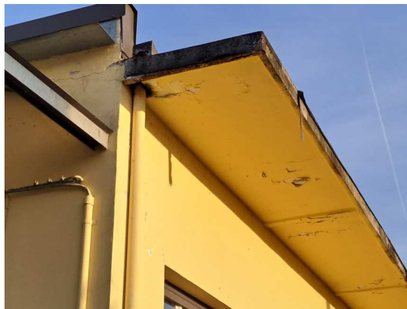
23 - Particolare della pensilina in cls lato ovest