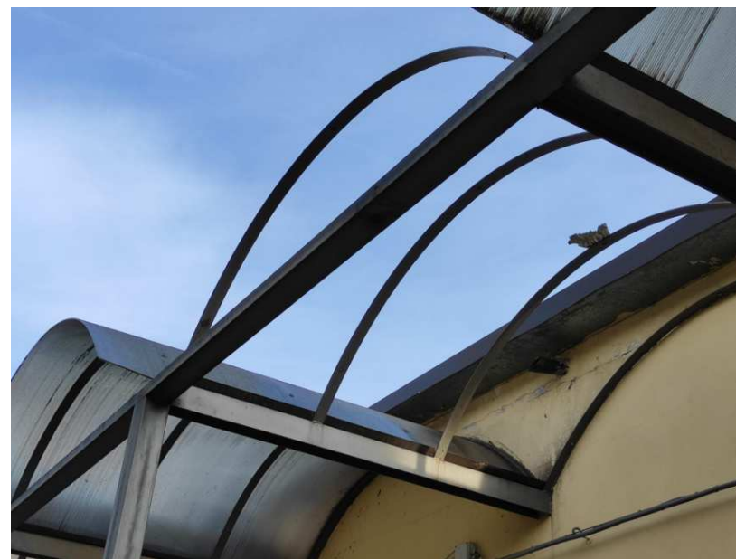
12- Particolare della pensilina