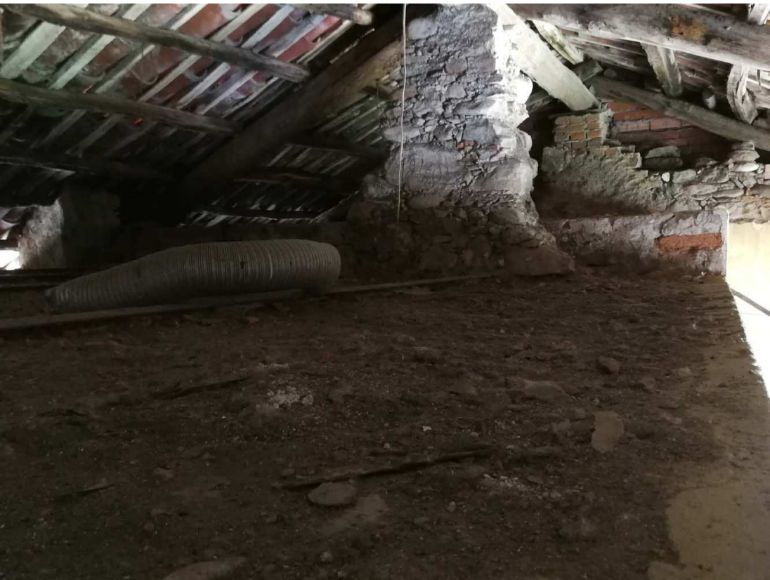
PARTE DEL COLMO E VISTA DELL'APPOGGIO CENTRALE