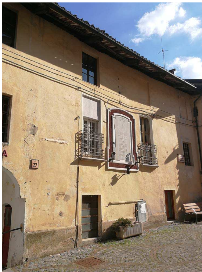
L'EDIFICIO EX SCUOLA ELEMENTARE DA VIA VITTORIO EMANUELE