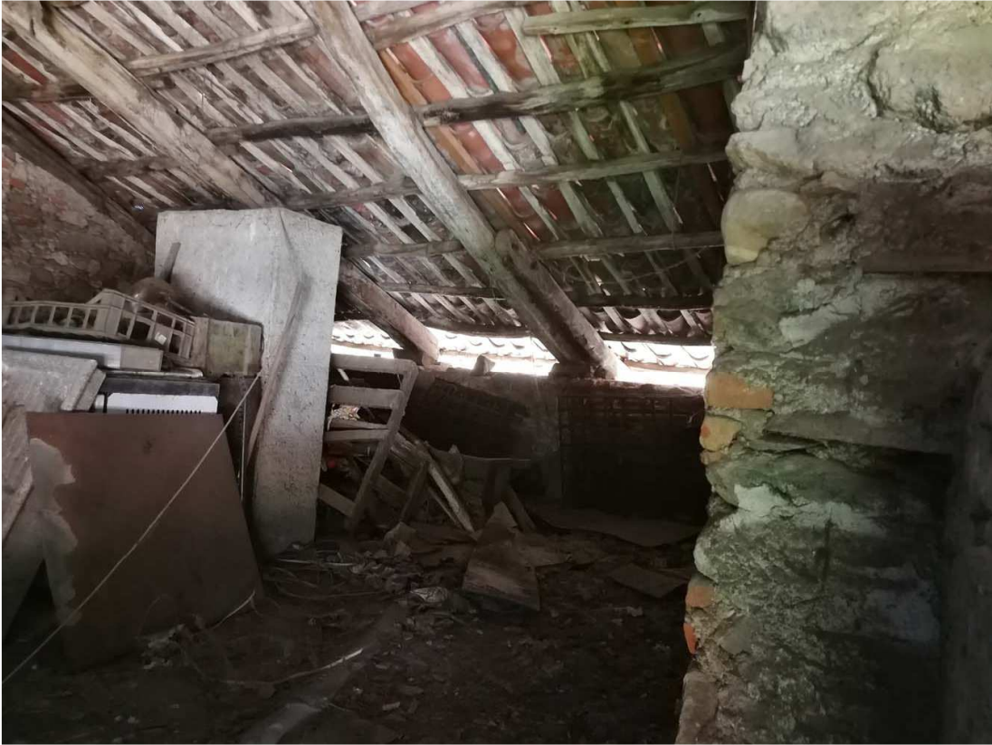
ALTRA VISTA INTERNA DELLA COPERTURA