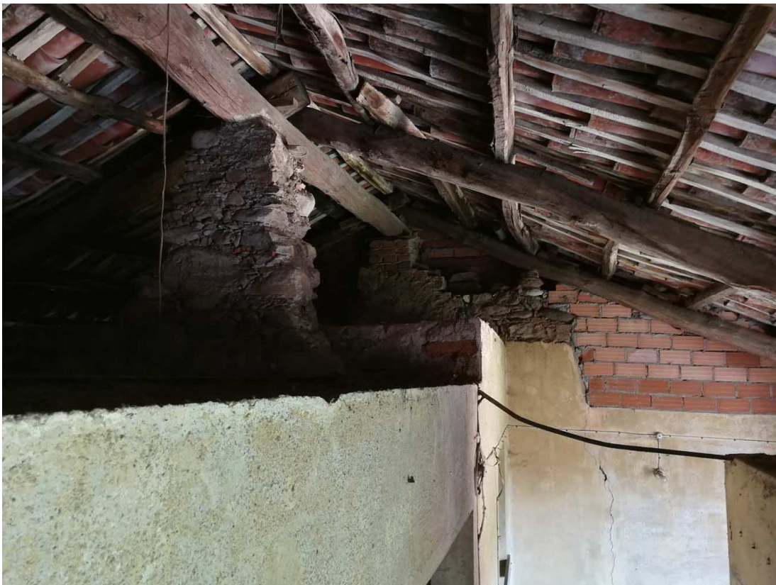
PARTICOLARE DEL COLMO E INCROCIO DEI PUNTONI SENZA LEGATURE