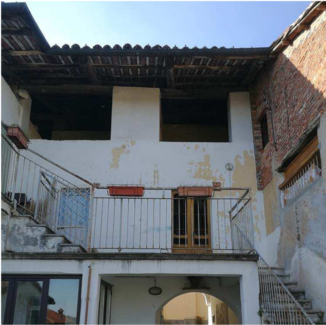
IL MANTO DI COPERTURA VISTO DAL CORTILE INTERNO