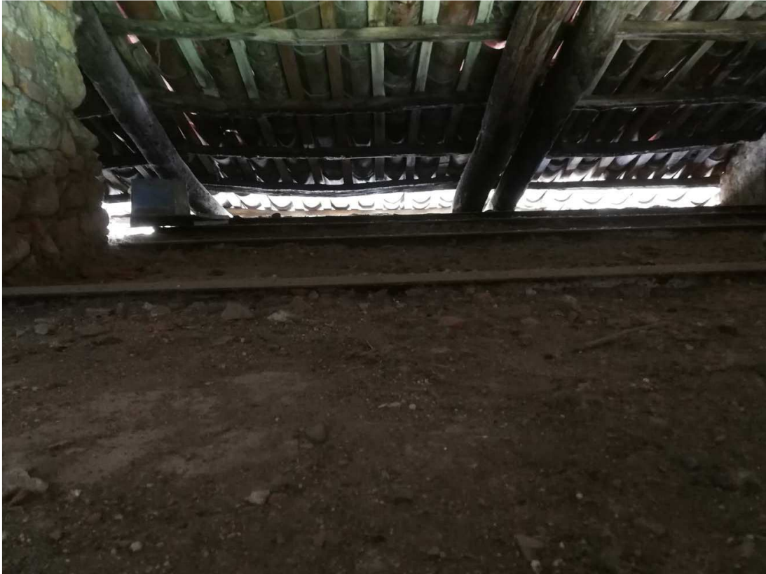
APPOGGIO PUNTONI SU MURATURA PERIMETRALE SENZA ELEMENTI DI FISSAGGIO