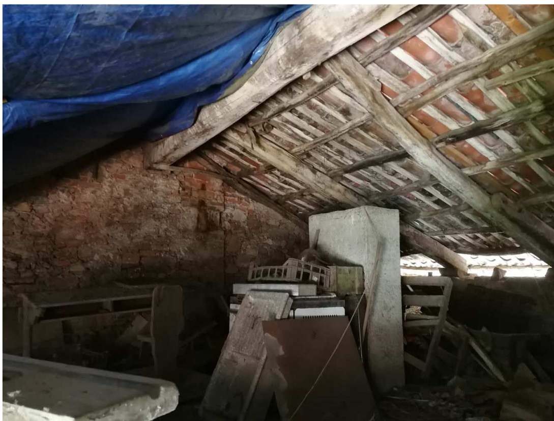
MANTO DI COPERTURA IN PESSIME CONDIZIONI DI CONSERVAZIONE