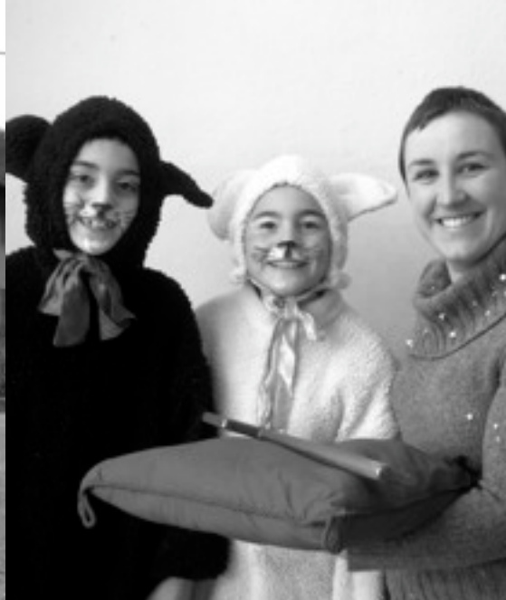
Immagini del Carnevale Vidracchese edizione 2010