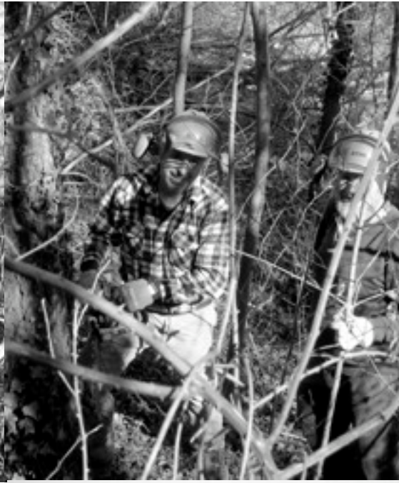
I primi interventi di diradamento dei larici alla Torre Cives